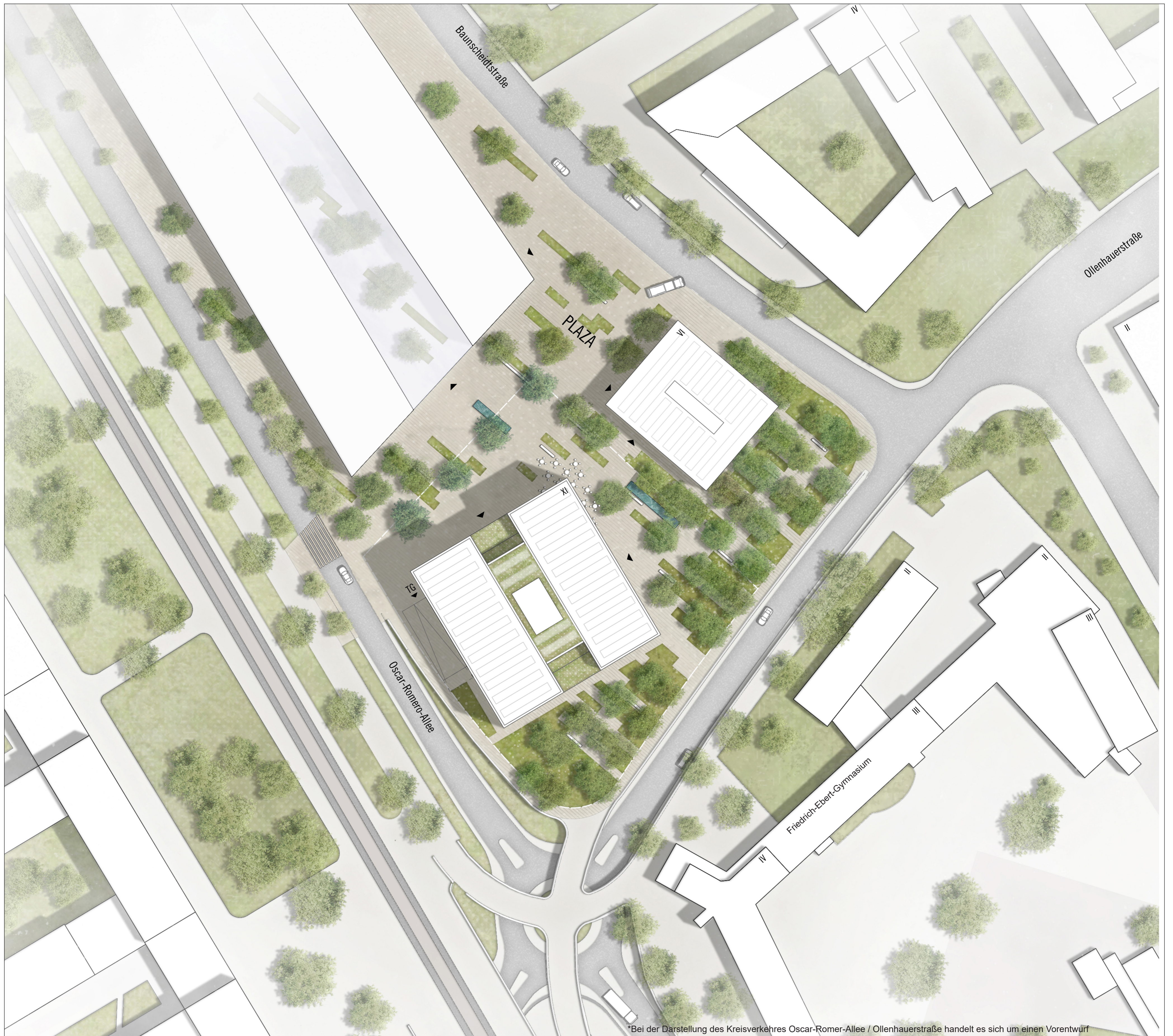
Lageplan i.M. 1:500 (ASTOC ARCHITECTS AND PLANERS GmbH)