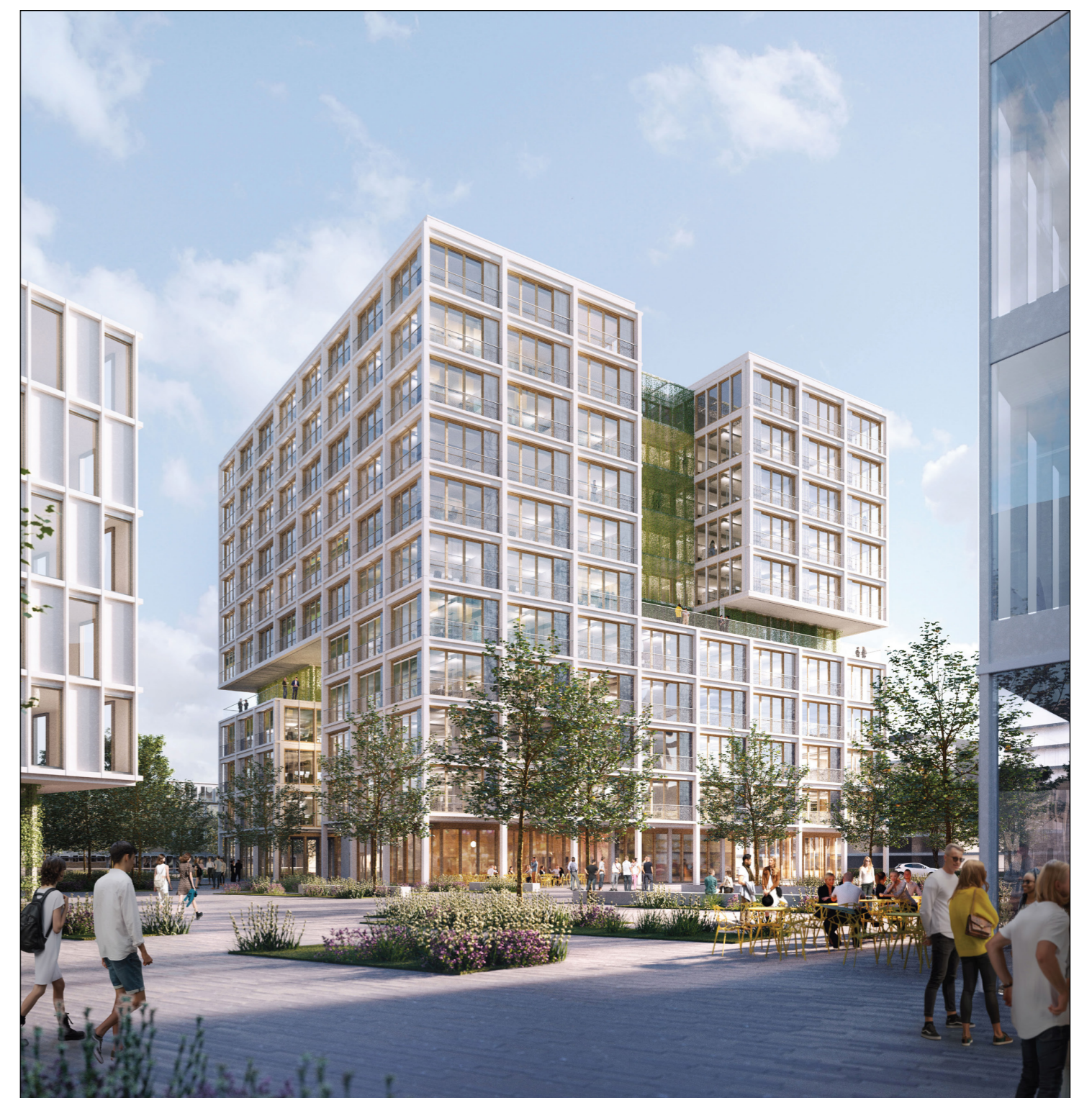
Visualisierung (ASTOC ARCHITECTS AND PLANERS GmbH)